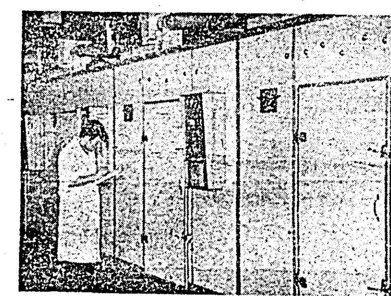
Incheind anul trecut cu realizări frumoase în îndeplinirea sarcinilor de plan, colectivul întreprinderii de stat „Avicola” este ferm hotărît să le amplifice pe măsura sarcinilor sporite și a exigențelor impuse de planul pe acest an. În imagine: secvență de muncă la stația de incubație, una dintre unitățile importante ale întreprinderii.

acel scop; — dacă bunurile degradate pot fi valorificate cu prețuri reduse, se ia în calcul diferența dintre prețul bunului respectiv și prețul ce se obține prin valorificarea; — dacă prin reparare sau reconstrucție se obține un bun de calitate inferioară, se adaugă diferența de preț dintre prețul bunului reparat sau reconstrucționat; — dacă bunurile degradate se utilizează ca materie primă pentru producerea altor bunuri, se ia în calcul diferența de preț dintre prețul bunului și prețul materiei prime pe care a înlocuit-o; — dacă bunurile nu mai pot fi reparate, reconstrucționate sau valorificate, în cazul cînd au fost produse în unitatea păgubită se ia în calcul costul de producție, iar în cazul cînd au fost cumpărate se iau în calcul toate cheltuielile făcute pentru procurarea bunurilor. În cazul în care paguba a fost produsă printr-o infracțiune, evaluarea acesteia se face adăugîndu-se la suma prin care unitatea a fost efectiv păgubită și foloasele de care ea a fost lipsită. IOAN PASCAL, consilier juridic la Consiliul județean al sindicatelor Arad