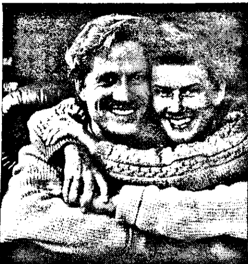
petreceți tot restul vieții!

2. Complexul de inferioritate - Femeile au, în general, o părere proastă despre inteligența și aspectul lor fizic. Convingeți-vă partenera că este frumoasă și că e femeia lângă care doriți să vă