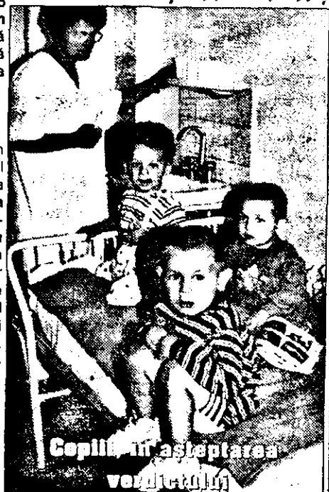
Copiii în așteptarea...