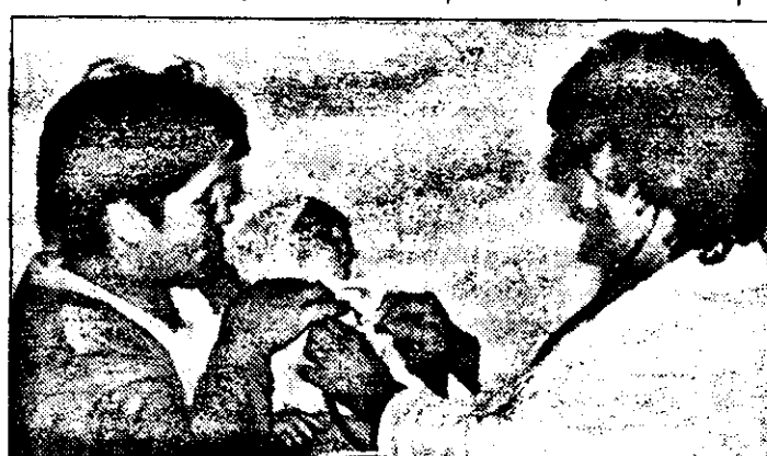
La Sânmartin, „actul medical” se înfăptuiește doar cu un stetoscop și un tensiometru...