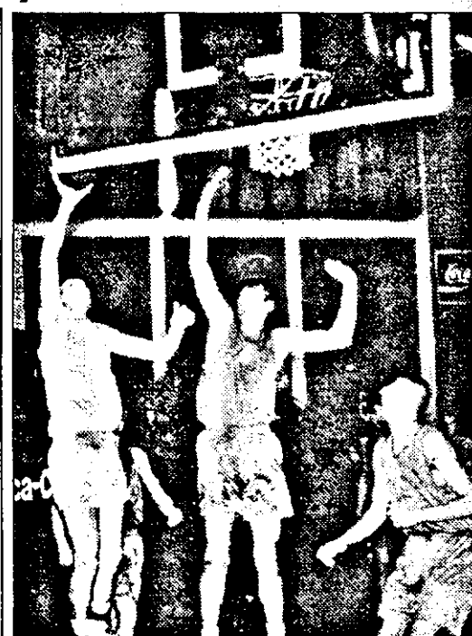
Dinamo, cu Caraian (nr.6) și Avramescu (nr.7) la recuperare, a câștigat partida cu noua promovată în Divizia A, West Petrom Arad.