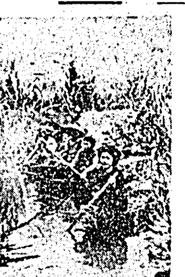
VIETNAMUL DE SUD. Tăranii și țăranele transportînd muniții prin cîmpia Jonc pentru Armata de Eliberare Națională.

Pentru a diminua valul criticilor, președintele a anunțat două „mini-retrageri” de trupe americane din Vietnamul de sud. Dar, el nu a făcut decât să atragă și mai mult asupra lui însăși fața de insuficiența acestor „dezechilibrări”. Numerosi congresmeni doresc ca planul de pace promis de președinte în timpul campaniei electorale să fie dezavuit. De asemenea, parlamentarii cu vederi realiste doresc să-i înfrîngă pe militarii și pe „ulii” care exercită presiuni asupra prezidentului și care cer o reglementare a conflictului pe calea forței militare.