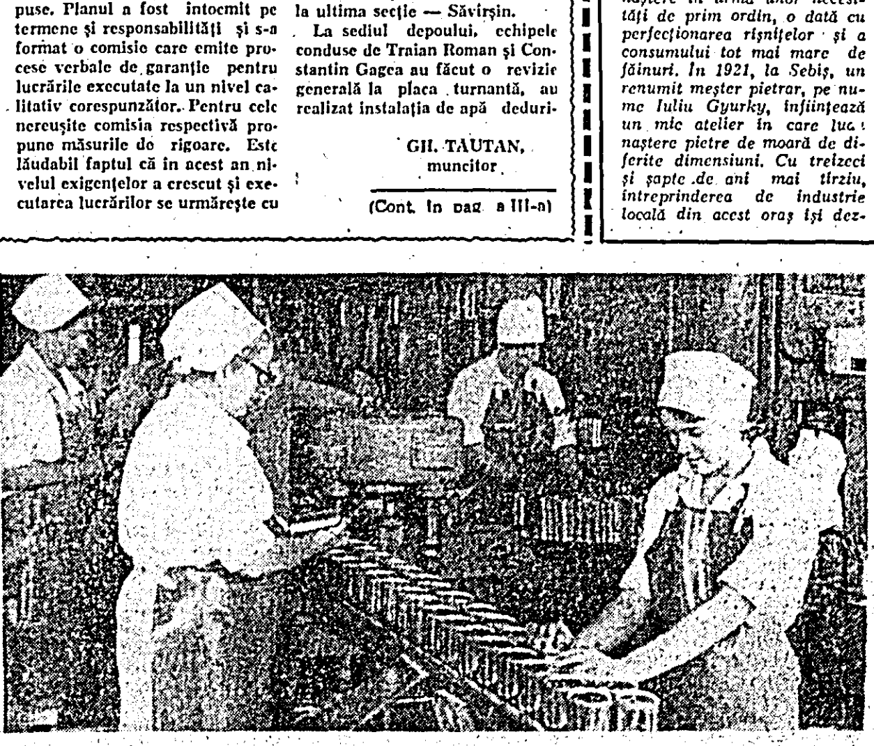
La fabrica de conserve „Refacerea” sezonul de conservare a legumelor și fructelor este în toat. IN CLISEU: un aspect din hala de prelucrare.