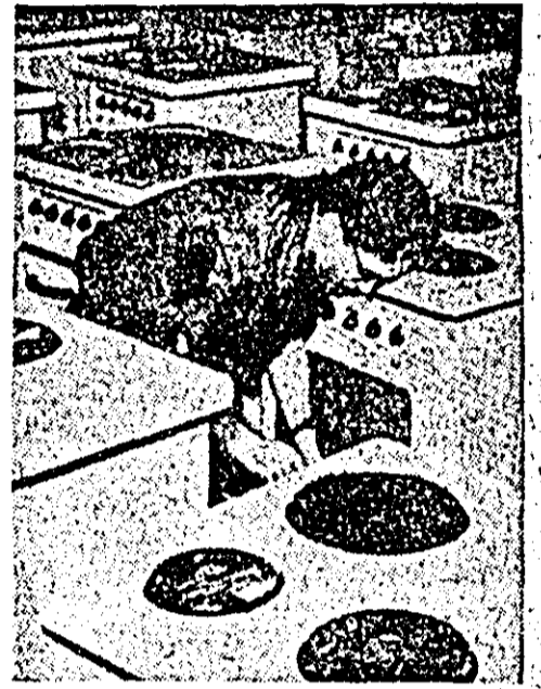
În clișeu: sobe electrice de gătit, fabricate de uzinele din Sörnewitz (R. D. Germană).