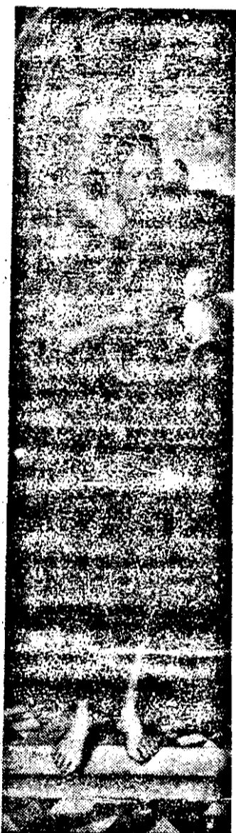
HANS MEMLING (Școala Flamandă) — Sfîntul Ioan Botezătorul (detaliu).

• Președintele sovietic Mikhail Gorbaciov a avut o declarație demisionar al afacerilor externe, Eduard Sevarnadze. Și nu se dau detalii în legătură cu conținutul convorbirii. Observatorii apreciază că Gorbaciov ar fi încercat, cu acest prilej, să-l convingă pe șeful diplomației sovietice să renunțe la hotărîrea de demisionare, anunțată total surprinzător la 20 decembrie.