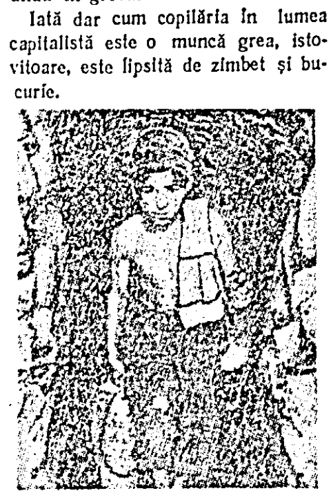
Micul ajutor de miner lucrează la mina „Ciancian”. Acest tînar italian are doar 14 ani, dar de 4 ani el lucrează în mină.

Realitatea îmbracă o haină și mai îngrozitoare atunci cînd îți dai seama că pînă și autoritățile școlare din S.U.A. — în loc să se ocupe de educația serioasă a copiilor — au început să se ocupe cu recrutarea de copii pentru muncă în cazuri de greve. Kenneth J. Kelley, consilier legislativ al Federației muncii din statul Massachusetts (S.U.A.) releva acum cîteva săptămîni că autoritățile școlare din Boston au eliberat „permise de muncă” pentru 20 copii în scopul de a fi folosiți la uzinele „Milham Products Inc.”, unde muncitorii se aflau în grevă. Iată dar cum copilăria în lumea capitalistă este o muncă grea, istovitoare, este lipsită de zîmbet și bucurie.