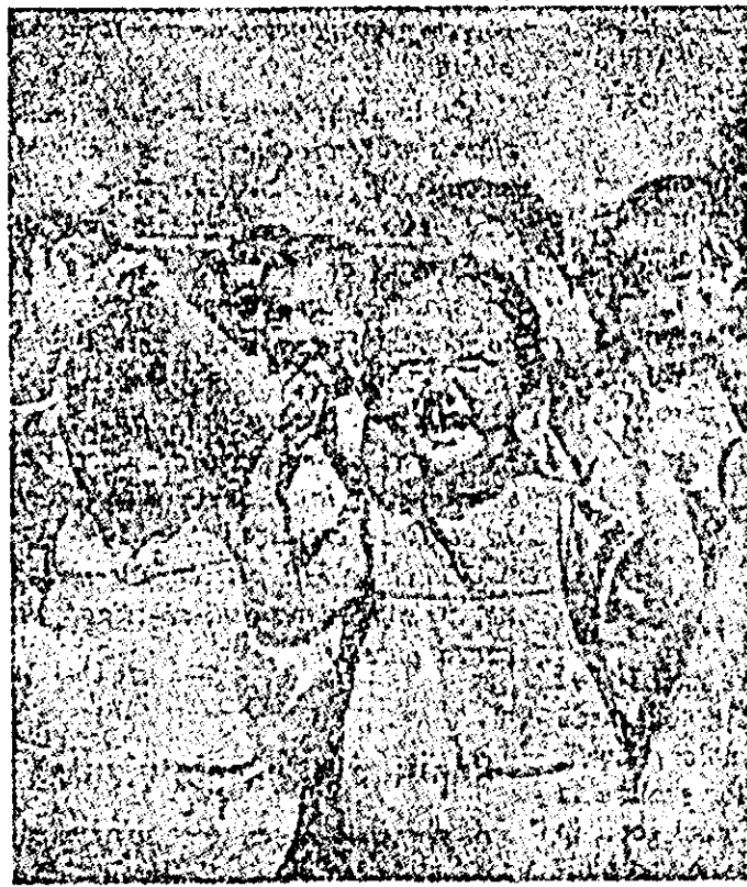
Ce poate fi mai grăitor decît aceste fețe luminoase, a ceste zimbete ferice ale micilor copii din China populară!

Copiii fac parte din cercuri alese după preferință și dau dovadă de un deosebit interes față de vasta activitate ce se desfășoară în cadrul palatului. Palatul pionierilor organizează numeroase reuniuni ale copiilor, vizite și excursii, întîlniri cu oameni de știință și activiști pe tîrîm obștească, precum și numeroase competiții sportive. În ultimul timp peste 70.000 de copii din acest oraș participă la activitatea de masă desfășurată de Palatul pionierilor din Pekin.