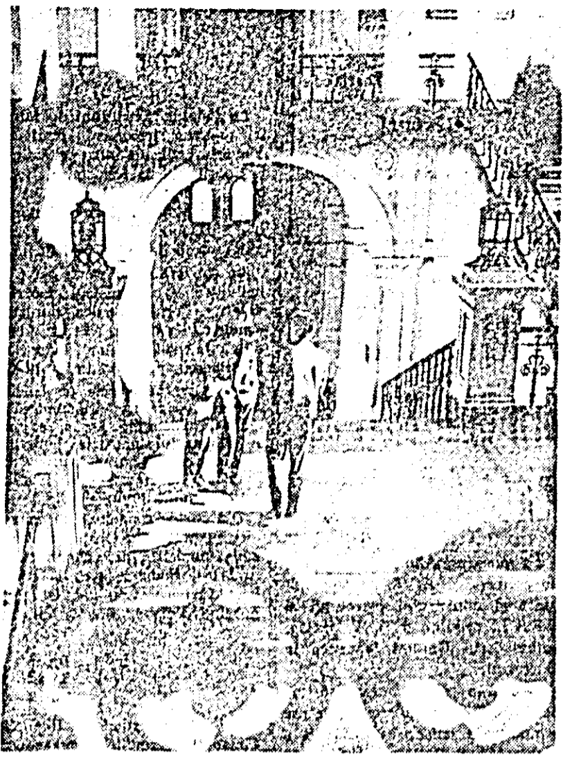
Liceul „Ion Slavici”. „Pausa mare”.

S-au încheiat întrecerile turului în divizia școlară și de juniori la handbal. Având o comportare bună în această primă parte a campionatului, echipa Școlii sportive din Arad a reușit să se claseze pe primul loc. Din cele 7 partide sustinute arădeanțele nu au pierdut decât un singur joc, în celelalte 6 obținând victoria. Echipa arădană (antrenată de prof. Ad. Szilbereisz) a folosit următorul lot de jucătoare: Vesa, Juhász, Marc, Ghilea, Bota, Mărieș, Guh, Someșan, Lalyer, Ranghet, Draga, Cojocaru, Toma, Cringasu. Felicitări pentru comportarea meritatorie de până acum! S. S. Arad 7 6 0 1 58—39 12 S. S. Cluj 7 5 1 1 63—37 11 Lic. 4 Timș. 7 5 0 2 65—37 10 S. S. Timș. 7 4 0 3 48—45 8 S. S. Năsăud 7 2 1 4 65—60 5 S. S. Oradea 7 2 1 4 39—53 5 S. S. Reșița 7 1 2 5 34—36 4 Lic. 2 Satu M. 7 0 1 6 34—99 1