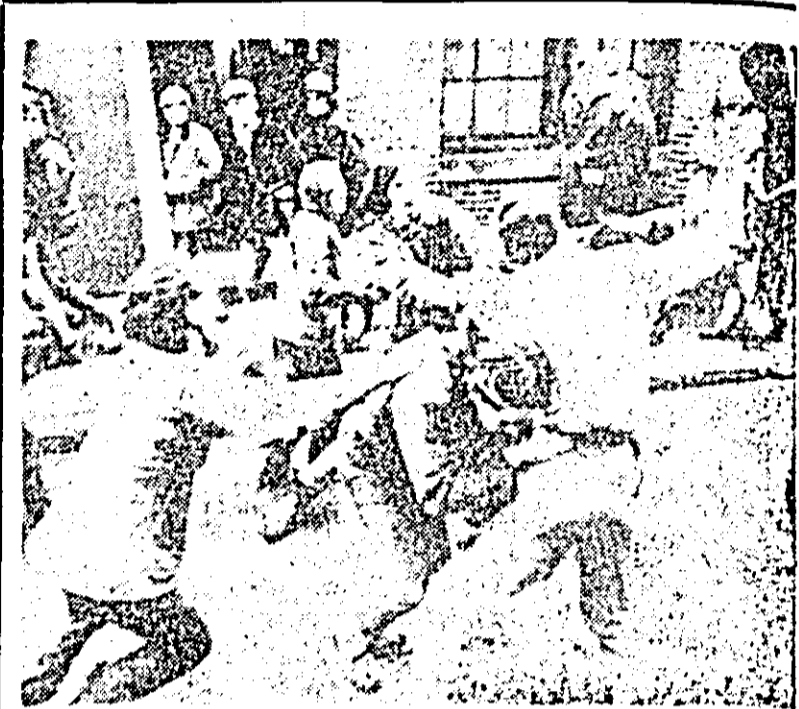
S.U.A. La Institutul de tehnologie din Cambridge (Massachusetts) a avut loc o demonstrație împotriva continuării războiului din Vietnam. Studenții au protestat împotriva studiilor întreprinse la laboratoarele institutului pentru materiale de luptă destinate războiului din Vietnam. IN FOTO: Demonstrații atacă laboranții la ieșirea din Institut.

HELSINKI 11 (Agerpres). — Ministrul de externe al Austriei, Kurt Waldheim, care se află într-o vizită oficială la Helsinki, a făcut cunoscut într-o conferință de presă că nu va fi publicat nici un comunicat la încheierea convorbirilor sale cu oficialitățile finlandeze. Referindu-se la propusa conferință în problema securității europene, Waldheim a relevat rolul pe care îl pot juca țările neutre în apropierea punctelor de vedere și grabirea convocării acestei conferințe.