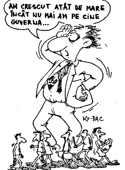
"Remaniererea Guvernului înseamnă că se schimbă persoane și acest lucru nu rezolvă problemele esențiale, de substanță. Eu nu am probleme cu membrii echipei guvernamentale. Echipa este eficientă și solidară în ceea ce face", a precizat Năstase. El a arătat că procedura de remanierere constă în faptul că primul-ministru propune schimbarea unui

Vineri, înaintea plecării spre Tunisia, președintele Ion Iliescu a precizat că remaniererea guvernamentală este "un atribut al primului-ministru", care, în momentul în care ajunge la o concluzie în acest sens, se consulfă cu șeful statului.