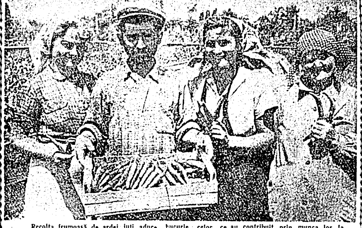
Recolta frumoasă de ardei tuși aduce bucurie celor ce au contribuit prin munca lor la acest succes.