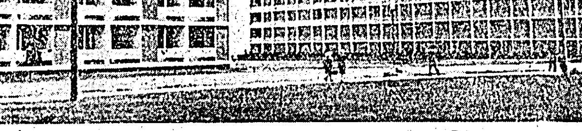
Construcții noi pe litoral