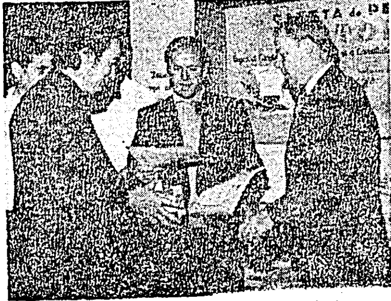
Aspect de la înmărmarea premiilor.

I la gazete satirice). Nădlac și Combinatul chimic (premiul II la gazete de perete), Sebiș și Direcția comercială județeană (premiul II la gazete satirice) Curtici și Birchiș (premiul II la gazete de perete). Întreprinderea textilă Arad și Întreprinderea de confecții (premiul III la gazete satirice). De asemenea, au fost distinse cu merituți alte 31 de comitete de partid din întreprinderile și comunele județului.