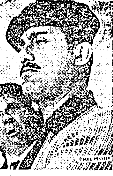
Secvență din film