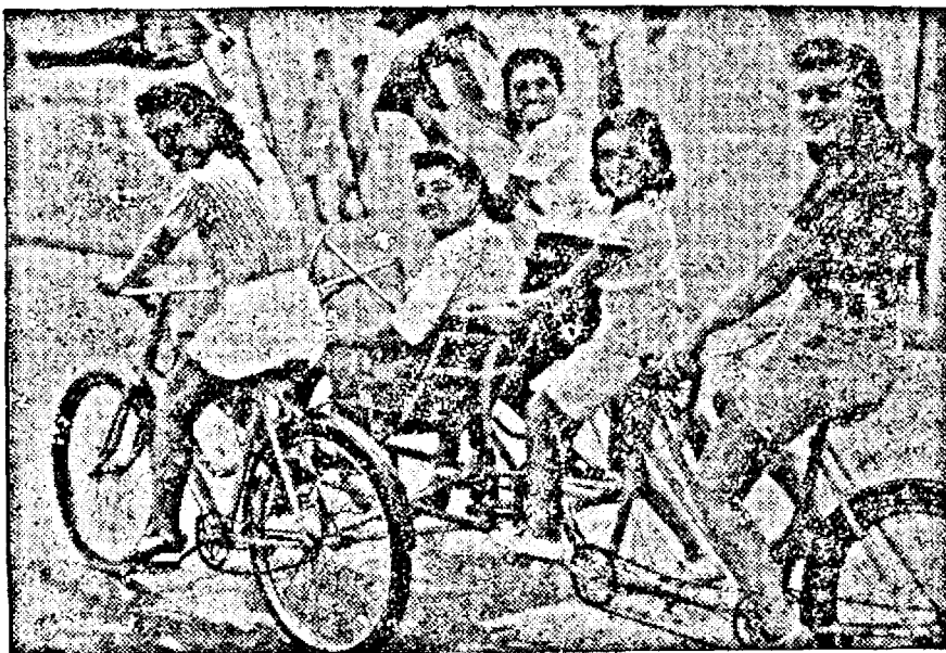
Un grup de fete vesele pe plaja dela Lido. Vehicolul acesta ingenios combinat servește pentru deplasări dealungul celebrei plaje a Veneției.