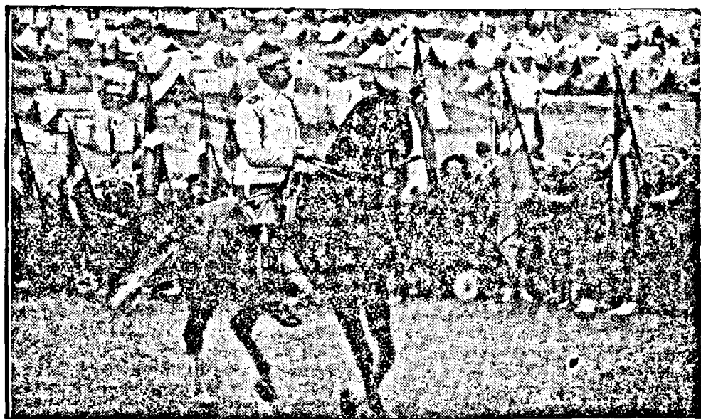
Regele Cristian al Danemarcei trece în revistă cei 2800 cercetași din tabăra dela Aarhus, unde și-a dat întâlnire și tineretului din Finlanda, Norvegia și Suedia. Prințesa moștenitoare Ingrid a Danemarcei a petrecut și ea două zile în tabără.