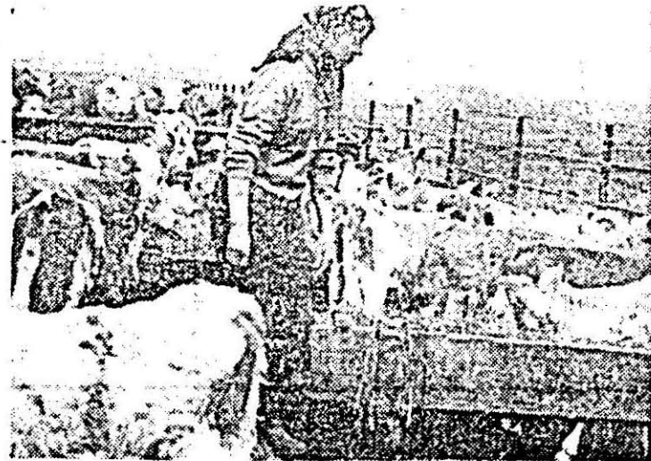
Tînăra îngrijitoare Floare Crișan, tot de la Vârșand, își face datoria cu multă pasiune și pricepere.

După cum am văzut, la Vârșand vițeii chiar și cei nou fătați stau în tabăra de vară, pe cînd la Șimand nu se poate. De ce? Fiindcă în tabăra de la Șimand nu există adăpost pentru viței și nici animalele adulte nu prea se pot adăposti sub jumătătea de copertină existentă (calitatea jumătății s-a dărîmat). În lipsa unor dotări corespunzătoare, vacile sînt scoase la pășunat numai pînă în jurul orei 16.30 cînd sînt readuse în adăposturi, urmînd să rămîină permanent pe pășune numai după ce vremea se va încălzi simțitor. Procedîndu-se astfel, zilnic se pierde timp bun de pășunat, între 5 și 6 ore pînă la lăsarea serii, urmînd să se mai dea ceva și la iesle. Deci, pe de o parte dîjmuirea furajelor destinate însușării, iar pe de alta producția mică de lapte, de numai 1,5 litri pe vacă furajată, pe zi. Aici mai sînt multe de făcut pînă să putem spune că zootehnia stă pe temelii trainice. Temelii care, sperăm, vor fi puse în cel mai scurt timp.