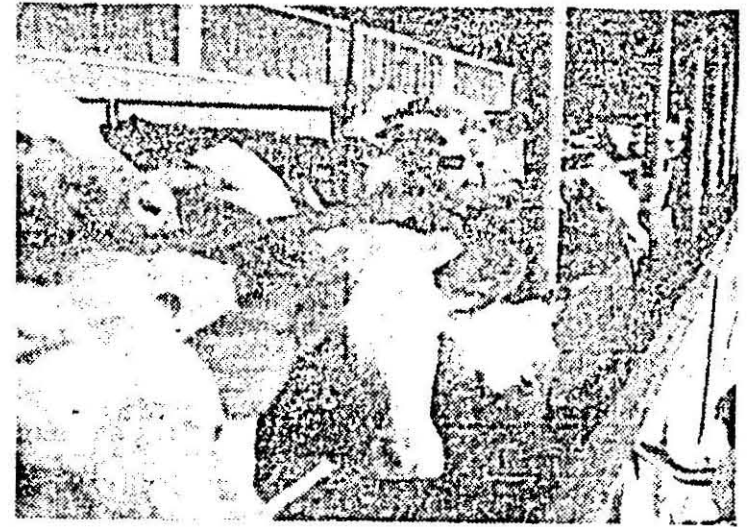
În loc să fie la pășune, animalele din lotul de tineret de la C.A.P. Șimand sînt furajate la iesle cu trifoliene masă verde.

— Ceva trebuie să dăm animalelor să mînce, ne spune și tovarășul Constan-