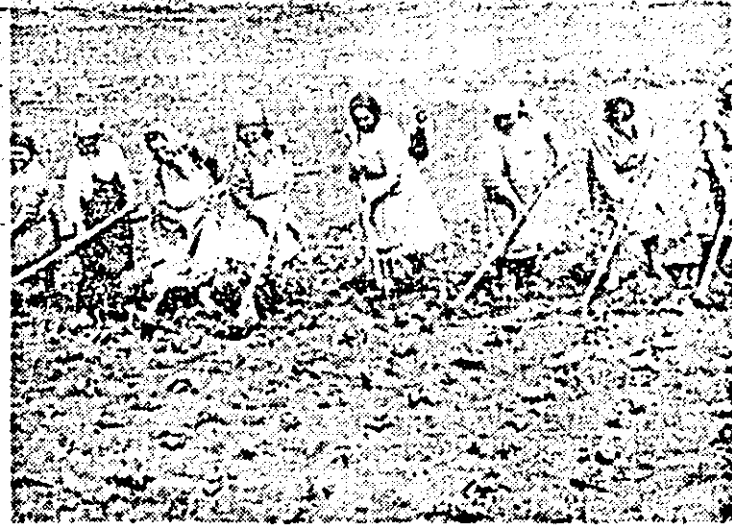
C.A.P. Felnaț, Zilnic, un mare număr de cooperatori este prezent la prașit.