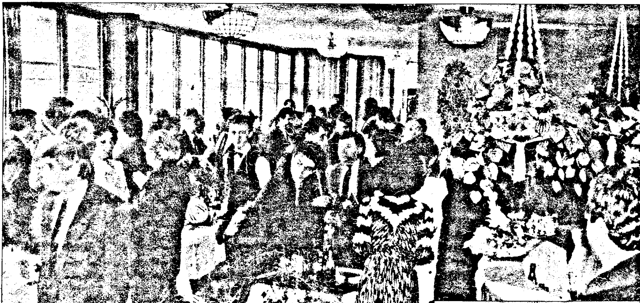
Atmosfera de la „Panoramic” a fost una de vis.

Reportaj de CAMELIA BERAR VALENTIN GROS