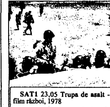
SAT 1 23,05 Trupa de asalt - film război, 1978

RTD-2 10,20 Sfântul se întoarce - serial american 11,20 Lobo, șeriful - serial american 12,20 Ruck Zuck