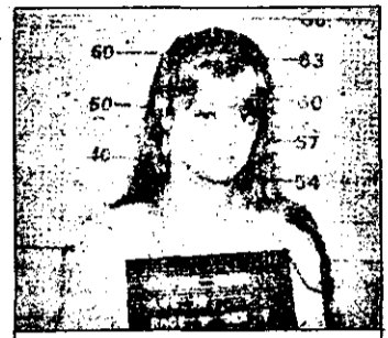
PRO 7 21,15 Lipsă de încredere - film TV SUA

23,25 Dracula și victimele lui - film groază SUA, 1967 7,00 Magazin matinal 10,15 Vecinii - reluare