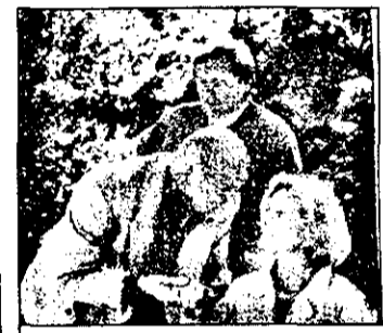
Bp.1 21,25 Mostenirea familiei Guldenburg

BUDAPESTA-2 11,00 Jurnal parlamentar 17,05 Afaceri, intreprinzator