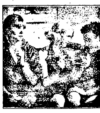
JOI RTL 22,15 CUTIT ÎN INIMĂ - f. german 1993