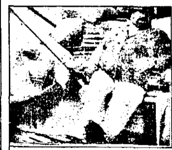
RTL 21,15 Doi superpolițiști la Miami - film polițist, SUA,

BUDAPESTA-1 7,05 Viața satului 7,25 Jurnal regional 7,35 Stiri economice