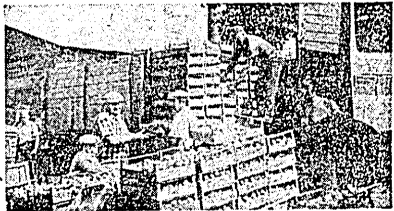
La C.A.P. „Avintul” din Pecica legumele sînt transportate operativ din câmp.