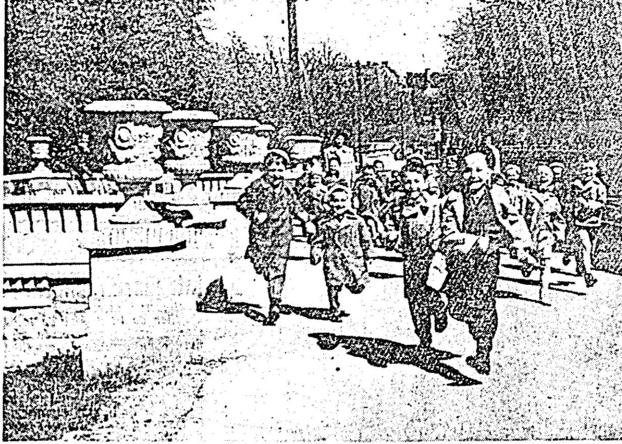
Zi însorită de primăvară. Sburdalnici și plini de voie bună, copiii din căminul de zi al cooperativei „Artex”...