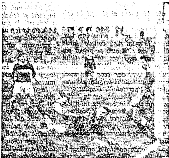
ÎN CLIȘEU: Pază din meciul CFR Arad - Corvinul Hunedoara câștigat de echipa arădeană cu scorul de 3:1. Portarul echipei oaspe a planșat tirul lui Calotă salvându-l cu capul, lovitura lui Klein, în corner.

În olasamentul pe regiuni Timișoara a ocupat locul I cu 4 titluri de campion.