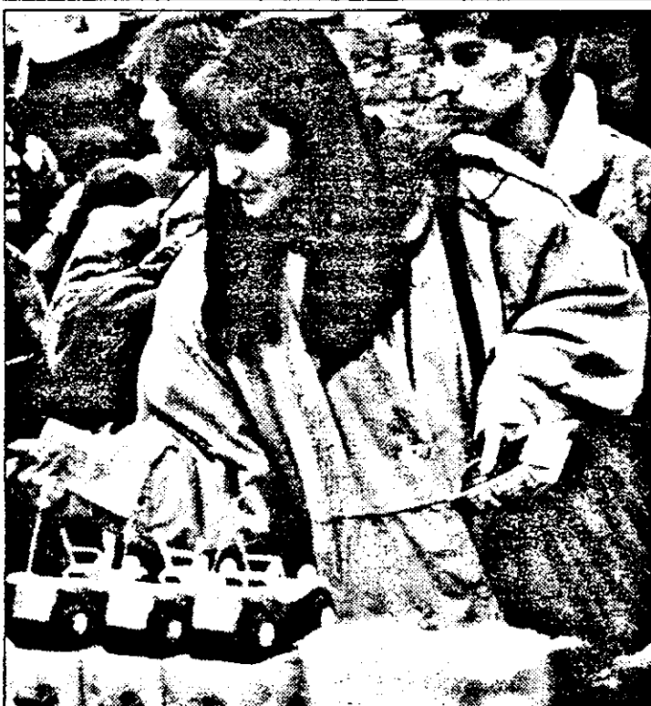
- Ce faci dragă, îi dai cât cere? Negociază și tu, poate mai lasă ceva...

Totodată, se va cere indexarea salariilor, care, la ora actuală, oscilează în jurul a 131.300 lei net, deși salariul mediu pe economie este (sau cel puțin așa se zice) de 239.000 lei. Dl. Balița mai spune că indemnizația promisă de Guvern pe trimestrul IV-1995 va sosi cel mai devreme în...aprilie. A.BOROȘ