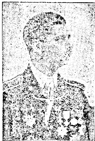
M. S. Regele Carol al II-lea

scurt cu cei de față și apoi au plecat cu toții înspre te-