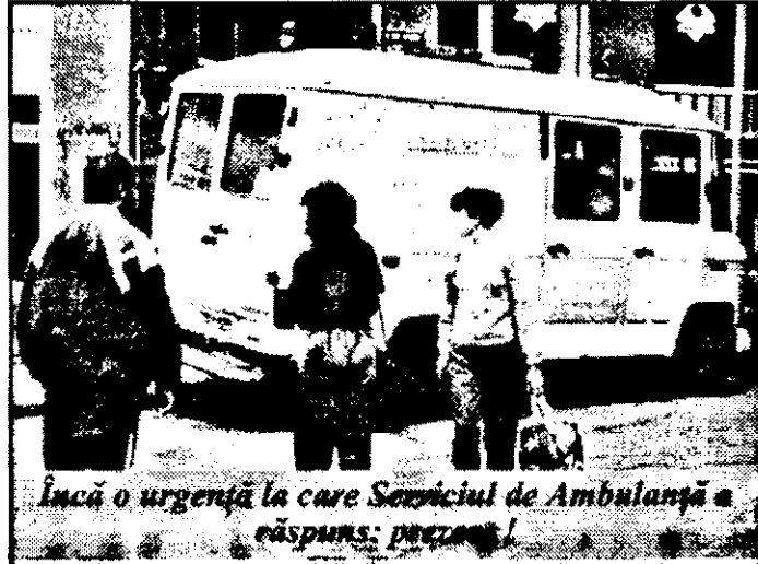
Încă o urgență la care Serviciul de Ambulanță a răspuns: prompt!