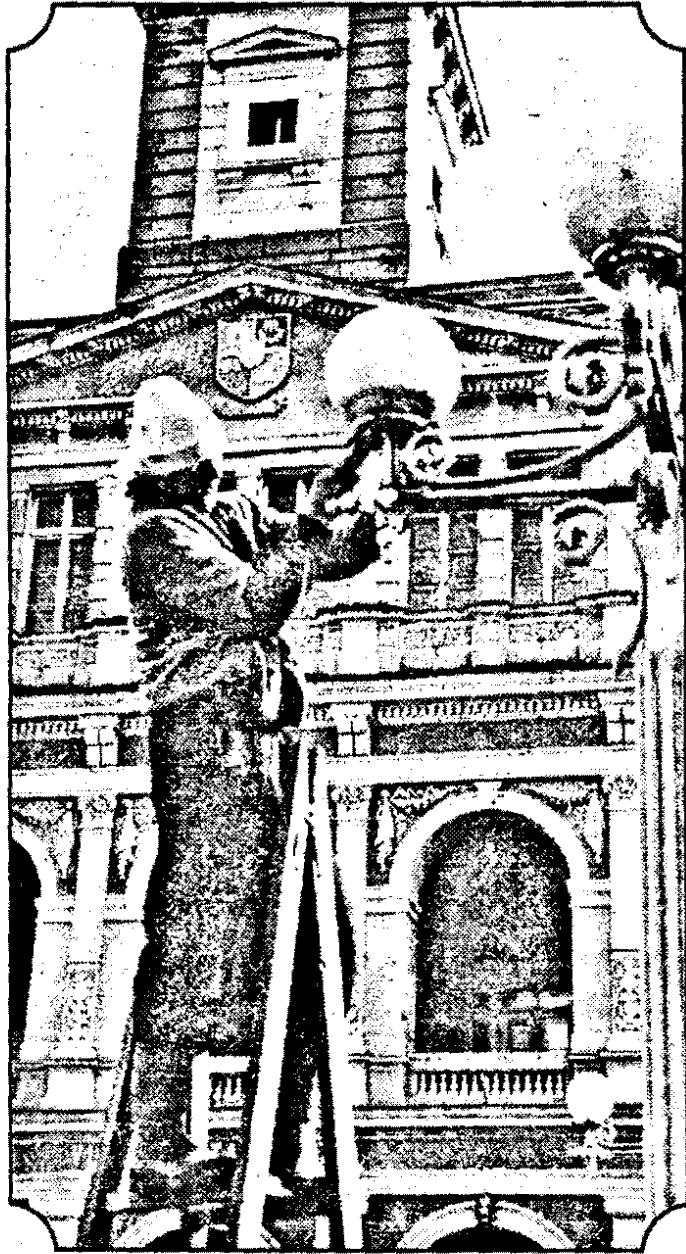
Dacă se schimbă becurile se va lumina, oare, și Primăria?

ELVIS trăiește? O anchetă a televiziunii britanice conchide că „da”! (Citiți în pagina a 8-a)