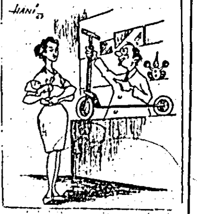
— Nu sînt cărăușoare, dar îi puteți cumpăra micuțului o trotinetă!

În magazinele orașului nostru, de mai multă vreme, nu se găsește cărăușoare pentru copii mici, deși cererea e mare.