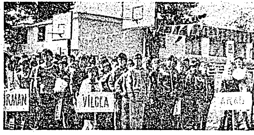
Aspect de la festivitatea de încheiere a Festivalului național de minibaschet.

Marți, la orele dimineții, pe o vreme splendidă, baza sportivă „Construcția“ din municipiul s-a încheiat în minimele de sărbătoare: sute și sute de foarte tineri sportivi din toate colțurile țării, se aflau alinați în fața drapelului patriei și a steagului „Dacia“.