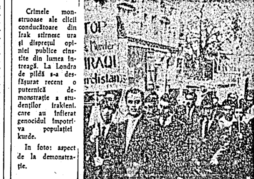
In foto: aspect de la demonstraţie.

„AŞEZĂRI ALE MIŞTERIEI“ IN ARGENTINA. CIUDAD DE MEXICO (Agerpres). Publicaţia mexicană „Cuadernos Americanos“ relatează despre situaţia proastă a locuitorilor din Argentina. Motivul publicat este că în Argentina numeroase familii aşterice se afluie în coşcobe, udeva în afara oraşului. Începând din 1940, acest fenomen a devenit atât de răspândit încât a dus la crearea unor adevărate aşezări de coşcobe răspândite în special în suburbiile oraşului Buenos Aires şi denumite oficial „aşezi ale mişteriei“.