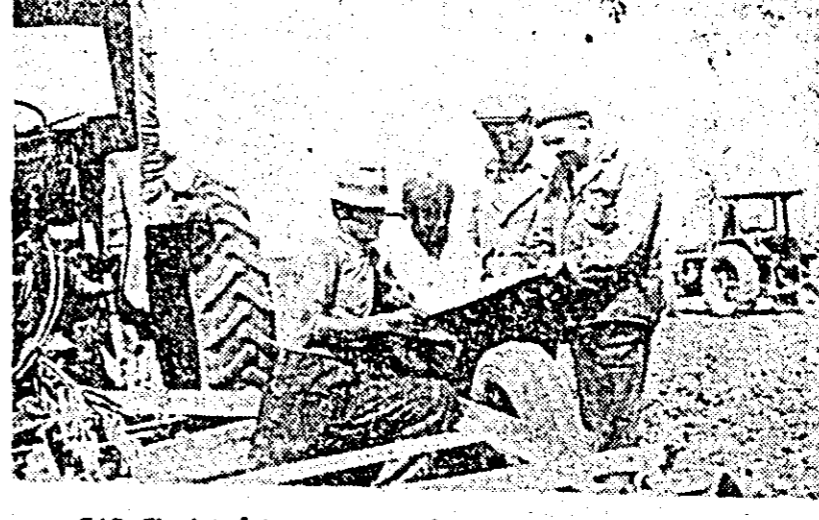
CAP Chesinț. Într-un moment de răgaz tractoriștii cîțesc cu deosebit interes scrisoarea secretarului general al partidului.