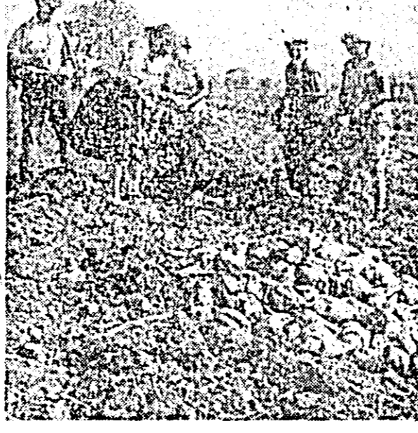
La CAP Neudorf se lucrează de zor la recoltatul sticlei de zahăr.