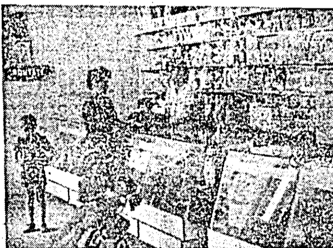
Aspect din unitatea nr. 93 a I.C.S. metalo-chimice, din Piaţa UTA.