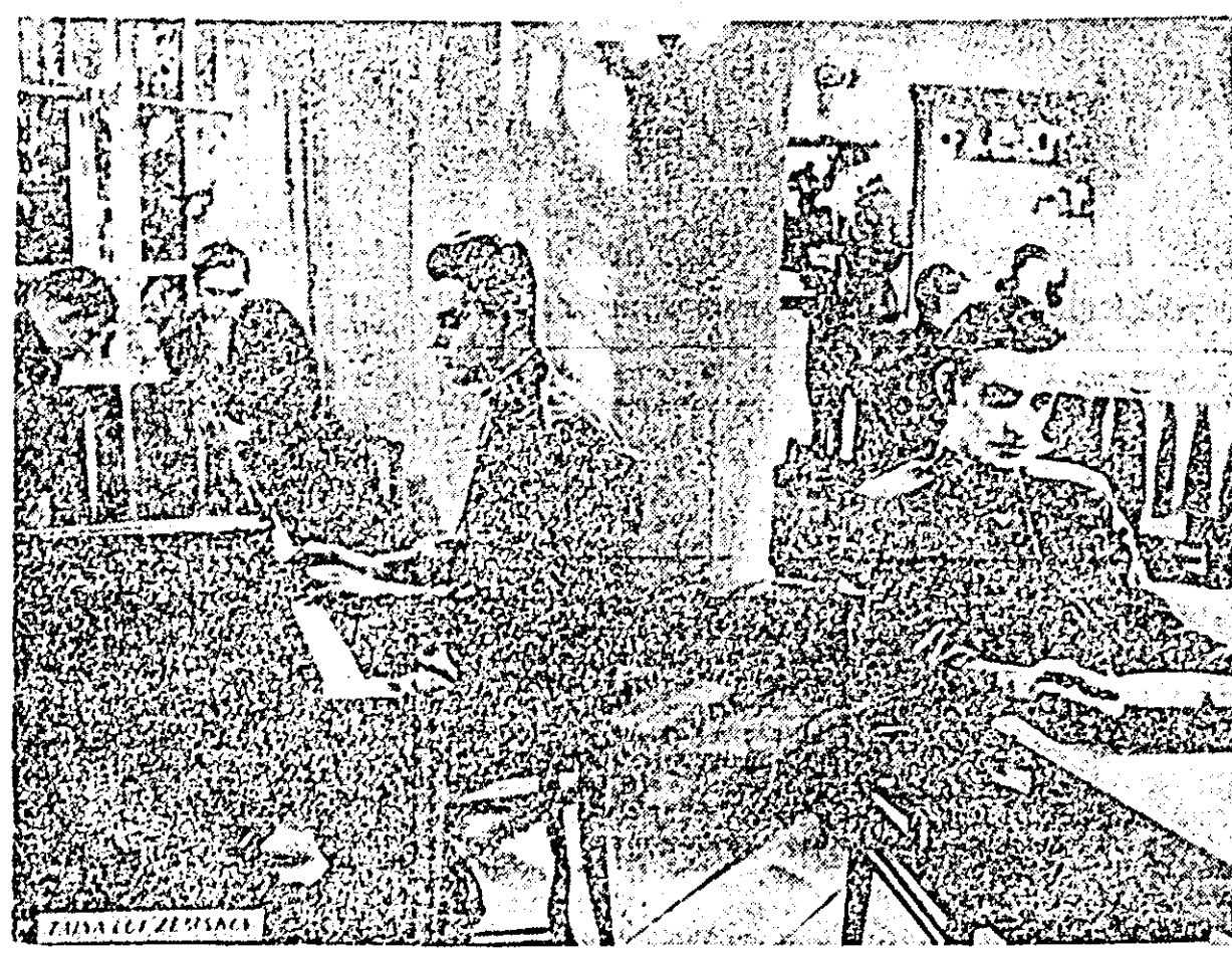
IN CLISEU: o scenă din film

Gospodăria agricolă colectivă din Șiră are plantată vie pe o suprafață de 207 ha. Producția de struguri se prevede a fi bogată, iar producția de vin ce se va obține a fost planificată la 30.000 litri. Pentru bunul mers al lucrărilor de recoltare și vinificație, paralel cu celelalte lucrări agricole ce se desfășoară în această perioadă, se fac de pe acum intense pregătiri. Bunoară, a început reparatul plvințelor și procurarea butoaielor. Butoaietele existente au fost revizuite și reparate și continuă procurarea altor butoaie pentru a se ajunge la capacitatea de depozitare necesară.