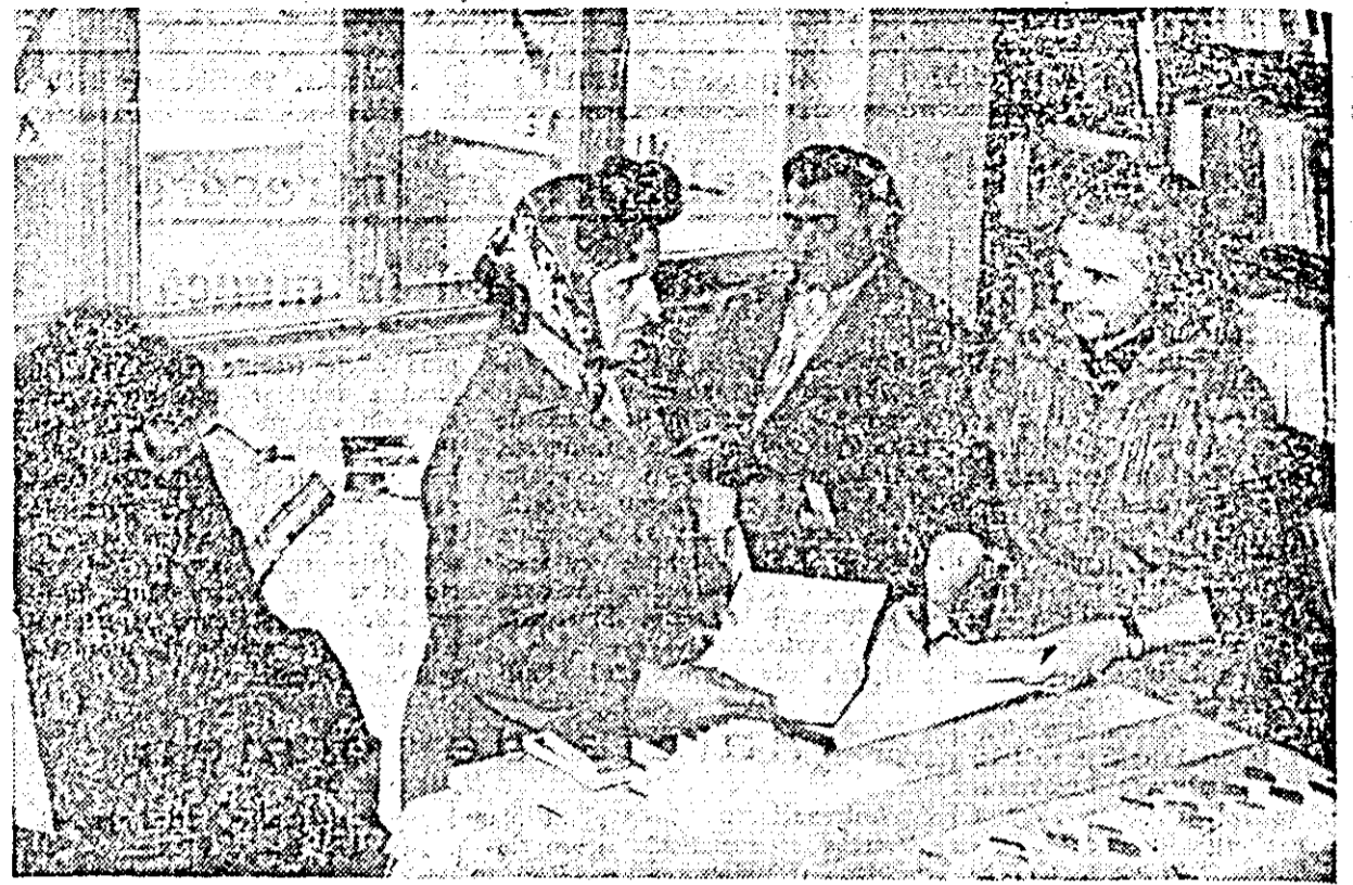
Unul din locurile frecventate de către constructorii de structuri este și biblioteca întreprinderii care este dotată cu un bogat fond de cărți. ÎN CLIȘEU: aspect de la bibliotecă.