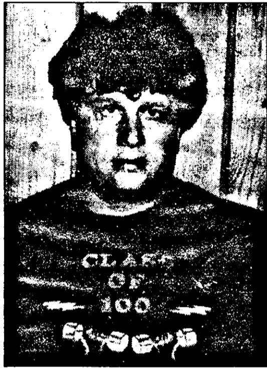
Halterofilul Nicu Vlad, medaliat cu bronz la Olimpiada de la Atlanta.