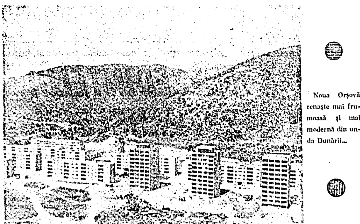
Noua Orșova renaște mai frumoză și mai modernă din unda Dunării...