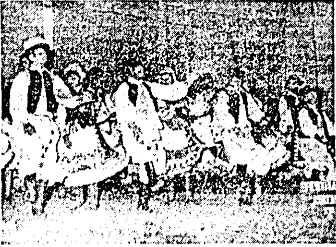
Pe scenă, formația de dansuri populare a căminului cultural din Șicula.