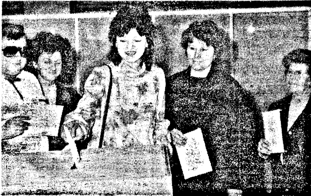
După aproape 45 de ani, la primul vot liber!