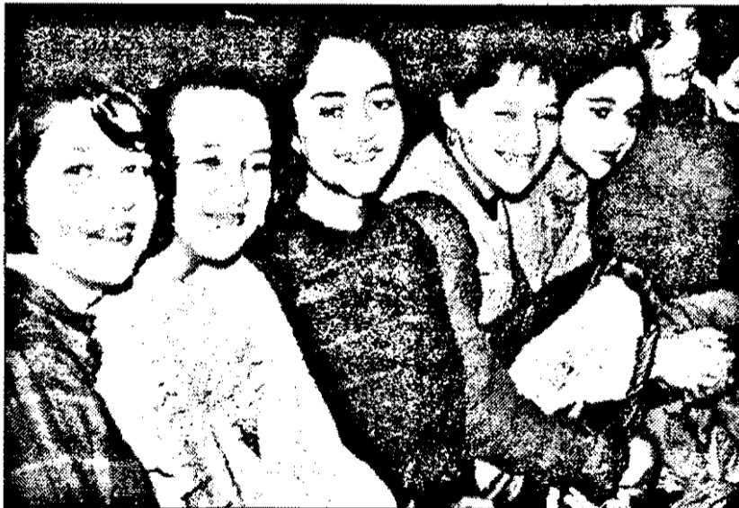
Un fapt imbucurător: sălile de sport sunt invadate de tineret, azi în tribună (fapt din Sala Sporturilor, la meciul de baschet feminin: BC Arad - Fartec Brașov), mâine poate cine știe...