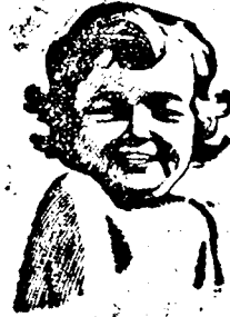
JELKÉPE A TISZTABÁGNAK.

A Cadum az arcszint gyöngéden felfrisítt és meztisztítja a bőrt anélkül, hogy ingerlő hatást váltana ki. Az anyák olyan tisztának és finomnak tartják.