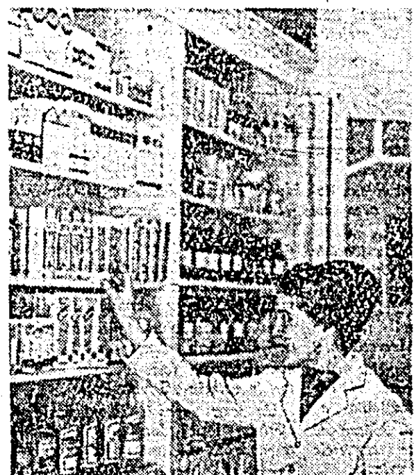
Un aspect din interiorul farmaciei.

Un alt cititor, pentru a veni și în sprijinul bibliotecarei, își alege singur cărțile. În fișa lui se înregistrează de astă dată: „Călușca atelutului”. O elevă de la școala medie din localitate consultă cu multă atenție indexul cu operele lui Mihail