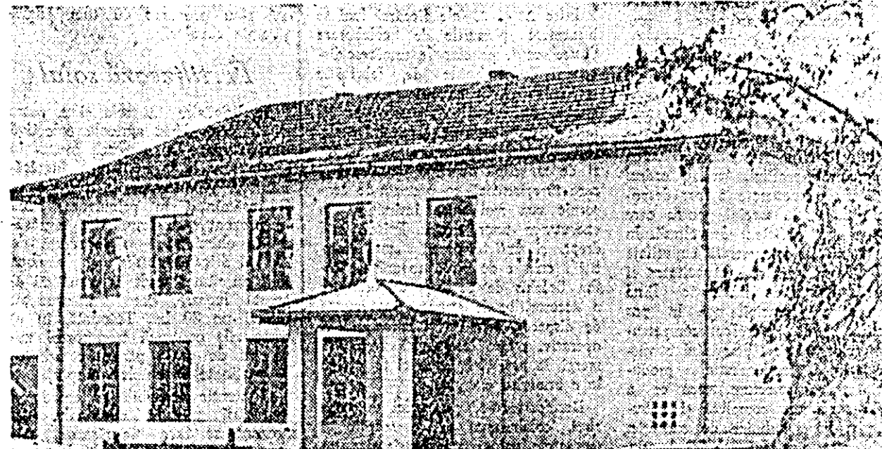
ÎN CLIȘEU: noul local al Școlii medii, care va fi dat în folosință în scurt timp.

Întorcem o nouă fișă din album. Întîlnim alte realizări.