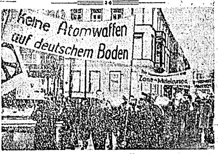
Prințul pancarde pe care sta scris: „Nici o armă atomică pe pământul german”. „Pentru o zonă demilitarizată în Europa centrală”, numeroși adepți ai mișcării pentru dezarmare din Düsseldorf (R. F. Germană) au demonstrat pe străzile orașului protestând împotriva politicii Bonnului de înarmare atomică.

El a declarat însă că, după părerea sa, actualul acord comercial anglo-sovietic pe termen de cinci ani reprezintă o bază satisfăcătoare pentru dezvoltarea comerțului anglo-sovietic.