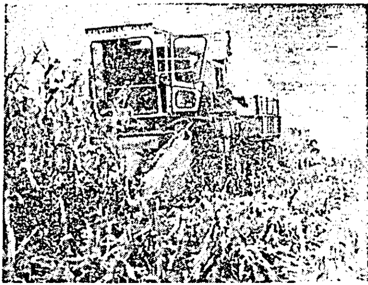
La seară se recoltează porumbul.