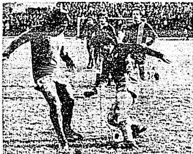
Giurgiu într-o acțiune personală care a premers al doilea gol al textilistilor.