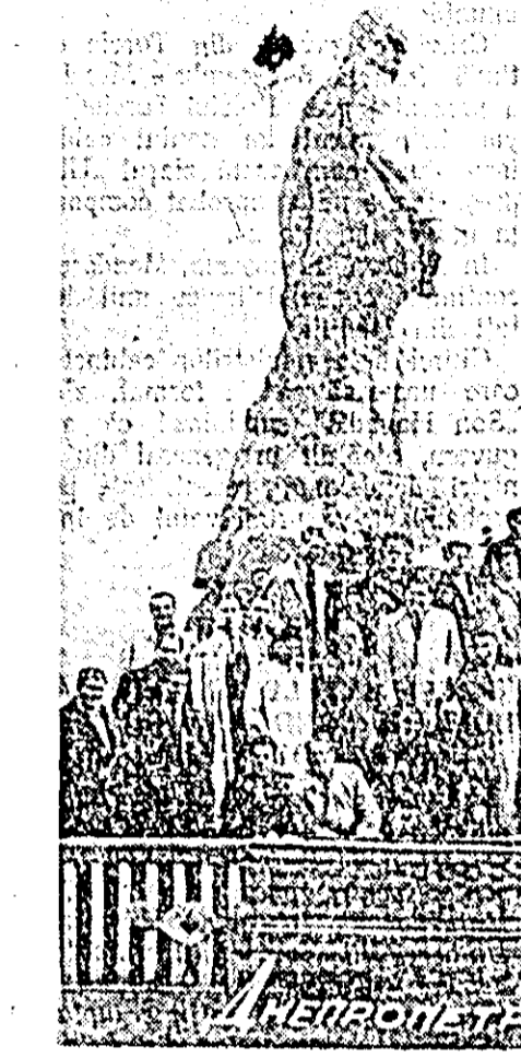
LISEU: o parte din delegația de activiști sindicali din țara noastră în fața statuii lui Taras Sevckenko din orașul Dnepropetrovsk.