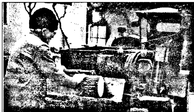
Mașina de tăiat lemne „CZUTH II” sau ce poate naște pasiunea unui mecanic priceput.