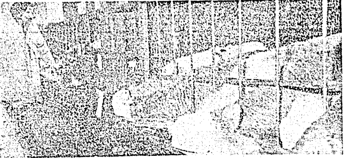
Mîinile care îngrijesc viteii de la C.A.P. Cermei și îi hrănesc cu atenție merită toată aprecierea căci aceștia sînt animale de excepție.

Se poate spune că și la cooperativa agricolă din Berechlu se constată o oarecare redresare a activității în zootehnie dacă ne referim la sporirea efectivelor de animale și la producția acestora. Astfel, în acest an, numărul de animale este în creștere, iar la lapte planul s-a depășit. Se constată însă că se menține prea mare consumul de lapte la vitei, iar în locul animalelor scoase din efectiv ca neproductive nu s-au cumpă-