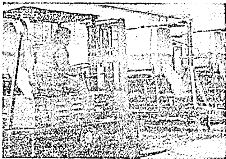
I.M.A. Un nou lot de utilaje este gata de a fi livrat beneficiarilor.