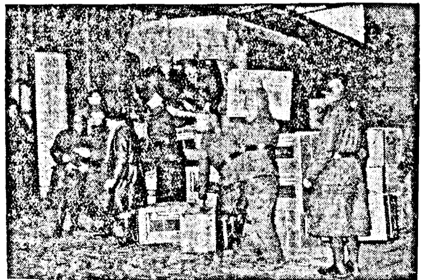
Purcei din serviciul de aprovizionare ale armatei franceze.

VITI DE ACEASTĂ DISPOZIȚIE SĂ FIE DELEGAȚI ÎN URMAȘIA LOR. NUMĂRUL LOR TRECE DE O SĂZĂCIME PRINTRE CARI SUNT 20 DE INGENIERI ȘI TEHNICIENI ANGAJAȚI ÎN ȘANTIERELE KRUPP, DELA CĂROR ÎNTRUNIRE S'AU ÎNTRUNIT ÎN URMAȘIA LOR. UNDE SE CONSTATĂ MOTIVELE ACESTEI MĂSURI SĂ FIE CUNOSC.