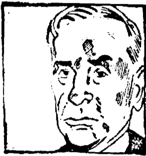
D. Cordell Hull

Washington, 10 (Rador). -- „Guvernul sovietic nu s'a conformat în total obligațiilor pe care și le-a luat atunci, când Statele Unite au restabilit relațiile diplomatice cu el”, -- aceasta este constatarea pe care o face d. Hull, într'o scrisoare adresată comisiei pentru afaceri străine a senatului, ca răspuns la cererea senatorului Vandenberg, ca Statele Unite să rupă relațiile diplomatice cu URSS. D. Hull adaugă totuși că guvernul american nu socotește că, continuarea relațiilor diplomatice cu URSS, trebuie să depindă în întregime de respectarea de către Soviete a garanțiilor date de Litvinov înaintea recunoașterii Uniunii Sovietelor de către Statele Unite. D. Hull a precizat că guvernul american are obiceiul, atunci când socotește că un guvern nu respectă obligațiile sale, să folosească calea diplomatică, pentru a-i atrage atenția asupra deficiențelor observate.