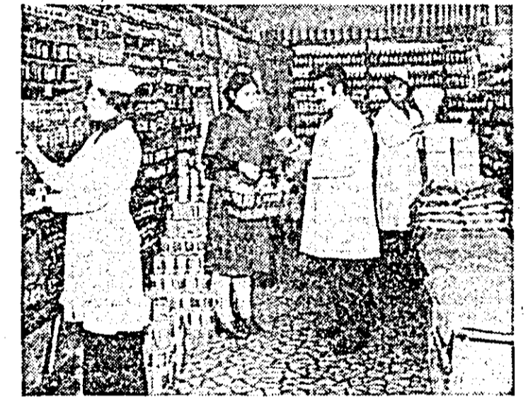
Pledoarie pentru un comerț civilizat. Aspect din magazinul cu autoservire din Lipova.

Popularea complexului cu juninci gestante și tineret a început, urmînd ca în această lună să-și ocupe locurile în grajdurile modernizate. Consemnînd avantajele modernizării, subliniem obligația conducerei întreprinderii de a asigura și celelalte condiții, în special baza furajeră necesară, astfel ca să se realizeze obiectivul principal ce revine modernului complex de la Semlac — sporirea producției de lapte.