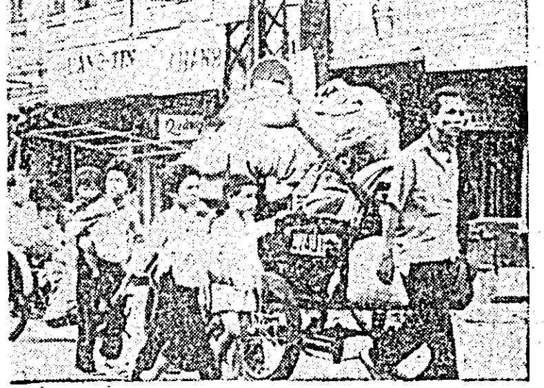
VIETNAMUL DE SUD. În urma luptelor între trupele americano-saigoneze și forțele patriotice, populația continuă să se refugieze.

LONDRA 18 (Agerpres). — Agențiile occidentale de presă anunță că duminică au avut loc la Londra cele mai puternice demonstrații înregistrate vreodată în capitala Angliei. În cadrul celor două demonstrații înregistrate din Anglia și din diferite țări vest-europene au protestat împotriva războiului dus de SUA în Vietnam. Ceea ce a început ca o demonstrație pasnică s-a transformat repede, în urma intervenției brutale a autorităților, în ciocniri sîngeroase între demonstranți și poliști. Aproximativ 150 de persoane au fost rănite, printre care 50, în stare gravă, au fost transportate la spital, numărul victimelor fiind aproape egal de ambele părți.