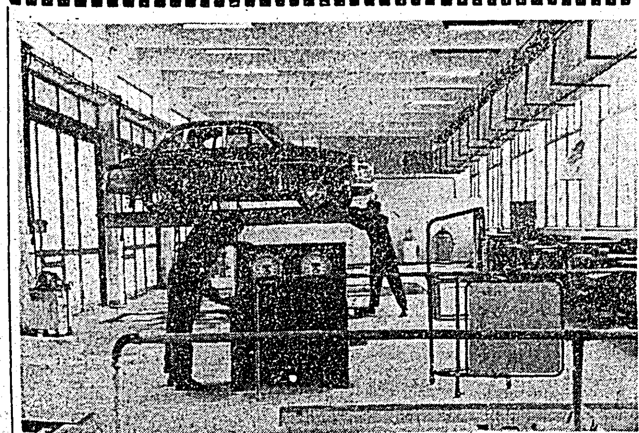
Aspect din interiorul secției autoservicii a cooperativei „Precizia” Arad.