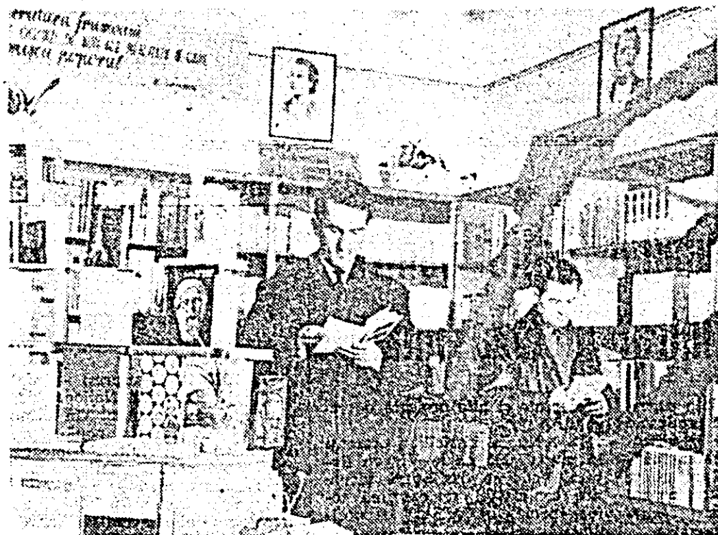
Secvență cotidiană la unitatea Bibliotecii noastre din orașul Lipova.