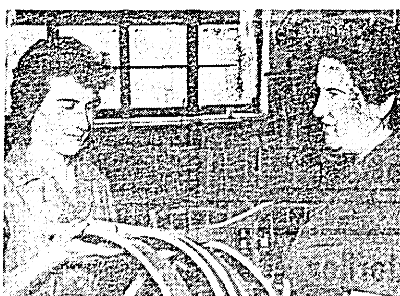
La fabrica „Răsăritul” din Pincota lustruitul scaunelor e încredințat celor mai de nădejde muncitori, specializați în această muncă.

Arad, Calea A. Vlaicu 274-276, telef. 18-00 intern 12. recrutează candidați pentru școli profesionale de ucenici în următoarele meserii: electricieni, morari, timplari.