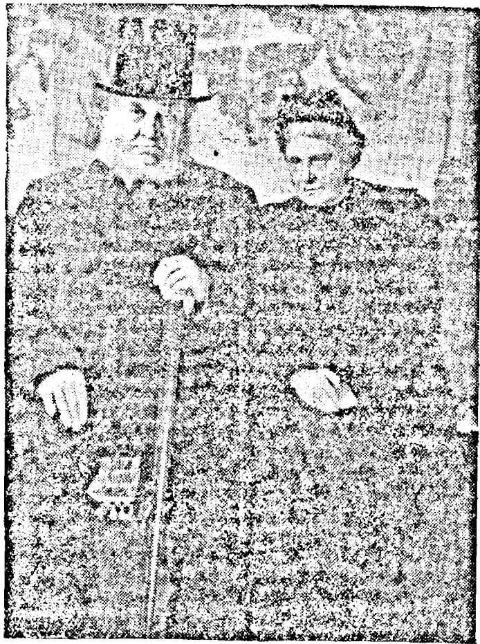
Ohm Krüger (EMIL JANINGS) și soția lui Sanna (Lucie Höflich) în filmul: „Răscala Burilor”.