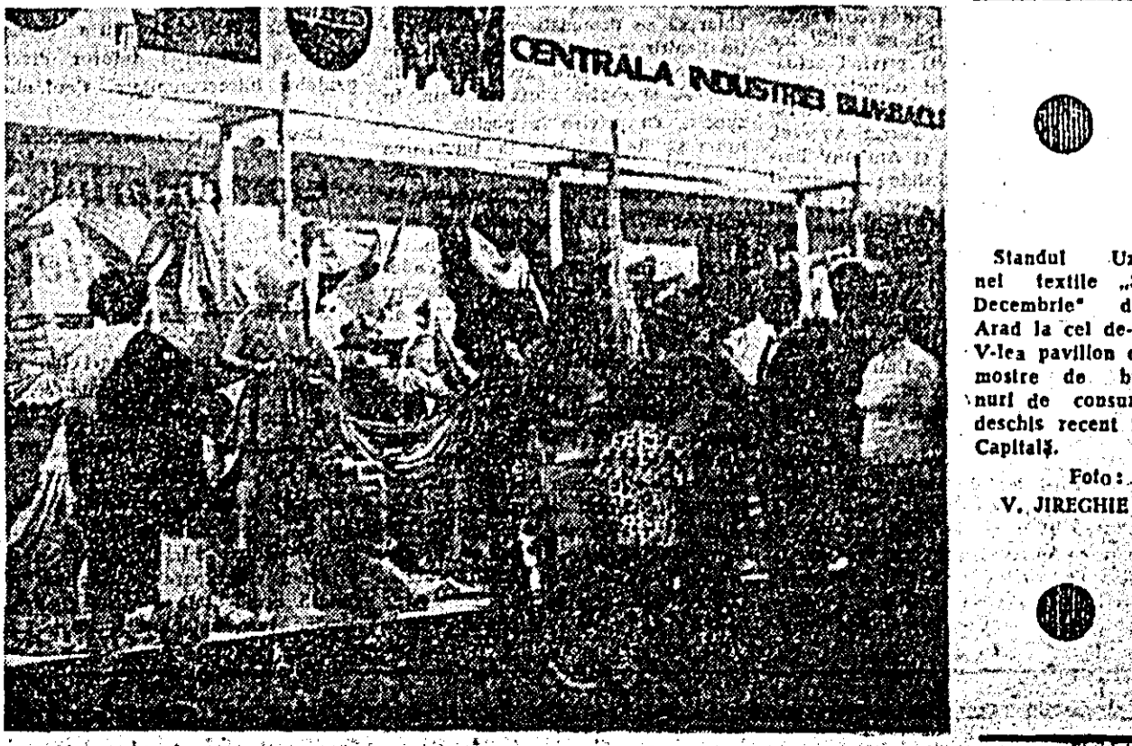
Standul Uzinei textile „30 Decembrie” din Arad la cel de-al V-lea pavilion de mostre de bunuri de consum, deschis recent în Capitală.