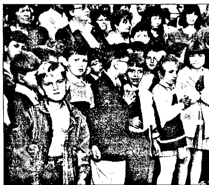
Emoții, emoții, emoții.

- Să fie într-un ceas bun! A consemnat, VASILE FILIP