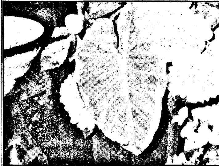
Aveți imaginea frunzei de cală, iar în colțul de jos al frunzei puteți observa porțiunea uscată care, din spusele d-nei Rusu, reprezintă chipul lui Iisus.