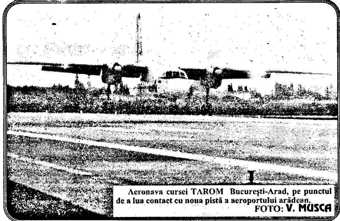
Aeronava cursei TAROM București-Arad, pe punctul de a lua contact cu noua pistă a aeroportului arădean.

D atorită lucrărilor de modernizare efectuate pe Aeroportul Arad, traficul acestuia a fost preluat, de aproape un an, de Aeroportul Timișoara. Acum, după redeschiderea aeroportului arădean ne așteptăm ca activitatea acestuia să revină cel puțin la parametrii din trecut, dar chiar să înregistreze o amplificare, având în vedere caracteristicile tehnice de vârf ale pistei. Dacă prin cursele TAROM București-Arad și retur, traficul intern a fost reluat, în ceea ce privește cursele internaționale începutul încă nu a fost făcut. Astfel, în aceste zile se duc tratative pentru readucerea pe Aeroportul Arad a cursei de Verona (Italia), care pe timpul lucrărilor de modernizare a fost mutată pe aeroportul timișorean. Pe lângă argumentele de ordin tehnic ale revenirii cursei pe aeroportul arădean, l-am putea adăuga și pe acela că, în acest fel, cursa revine pe aeroportul care a găzduit-o pentru prima dată.