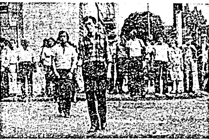
... Conștenții la regulile de circulație (și la cele de conduită civică!)

Mai există destul cetățeni, înierî mai ales, care „bravează” traversind strada pe calea rîșle a semaforului.