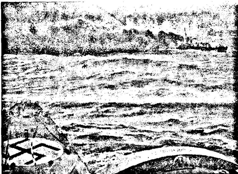
Vernichtung eines englischen Zerstörers auf hoher See

Laut Meinung französischer Militärkreise wird es den deutschen Streitkräften gelingen, noch tiefer einzubringen.